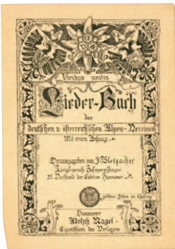
Josef Bletzachers Lieder-Buch des deutschen u. österreichischen Alpen-Vereines (Titelseite).